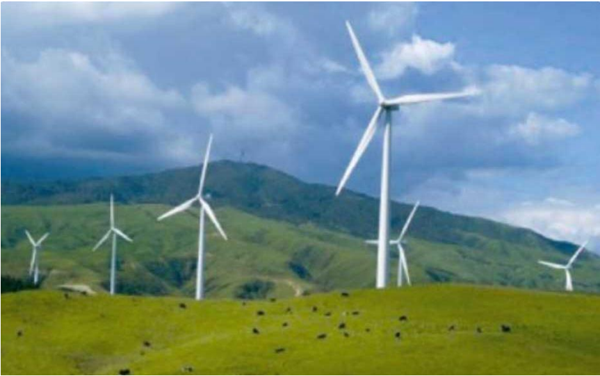
Рис. 1 – Вітроустановки з заглибленим фундаментом